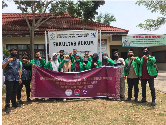
Pimpinan BEM,DPM dan FKPH Fakultas Hukum Unimal dilantik.