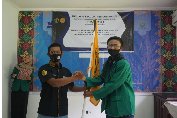
Penyerahan petaka Himpunan Mahasiswa Komunikasi Universitas Malikussaleh dari pengurus demisioner kepada pengurus baru periode 2020/2021.