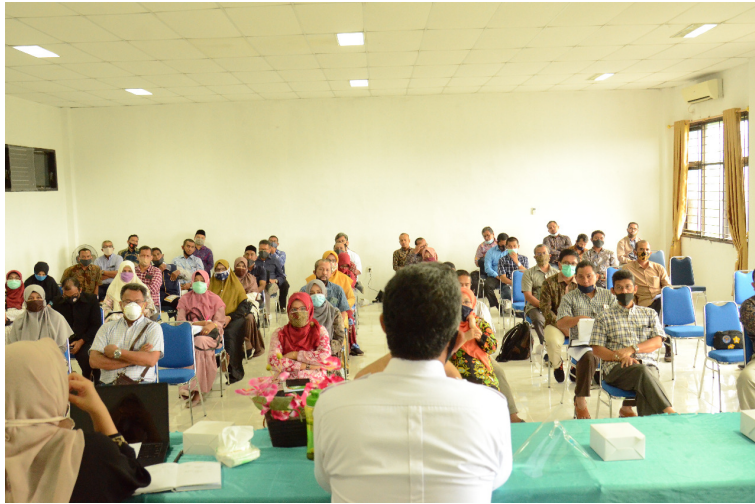
Wujudkan Kurikulum Merdeka, Unimal Gelar Rapat Koordinasi dengan semua Kaprodi.