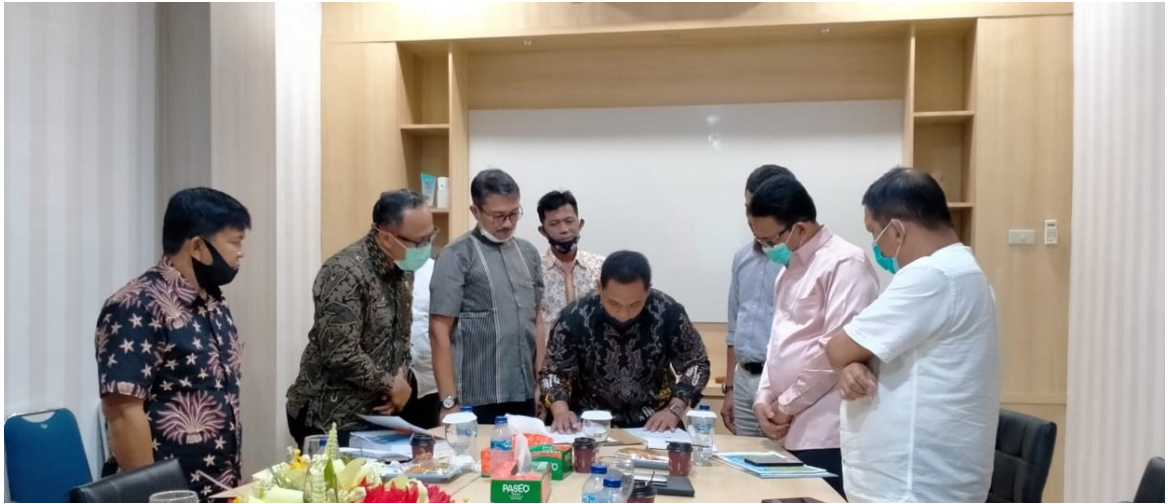
Penandatanganan Nota Kerja Sama Fakultas Teknik Unimal dengan Dinas Pariwisata Kabupaten Aceh Selatan beberapa waktu lalu.