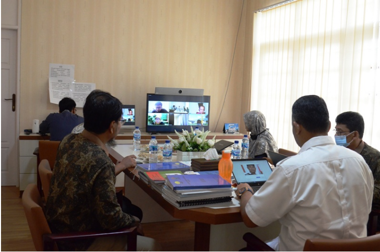
Pogram Studi Pendidikan Kimia Fakultas Teknik Universitas Malikussaleh asesmen lapangan secara daring untuk akreditasi dari BAN-PT.