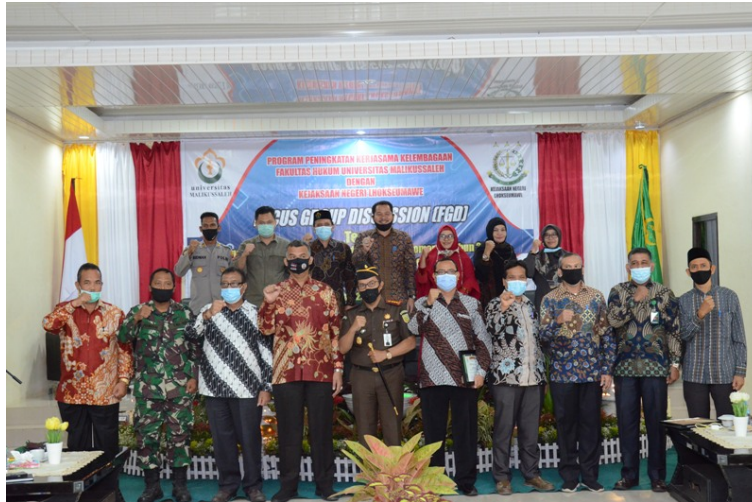
Fakultas Hukum Universitas Malikussaleh menggelar kegiatan Focus Group Discussion (FGD) dan penguatan kerja sama kelembagaan dengan Kejaksaan Negeri Lhokseumawe secara virtual, Kamis (22/10/2020) di Aula Cut Meutia, Kampus Bukit Indah, Lhokseumawe.