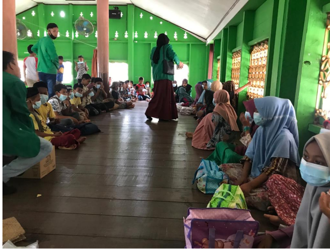
Mahasiswa KKN Kelompok 46 Gelar Pengajian Rutin Kepada Anak-Anak.