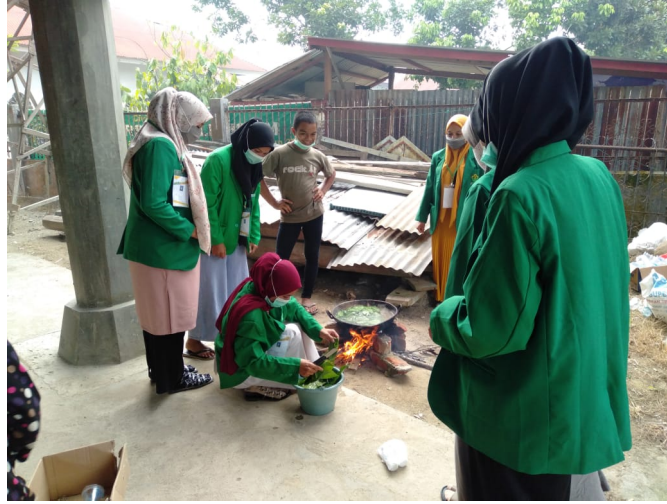
Mahasiswa KKN 161 Buat Hand Sanitizer dari bahan Alami.