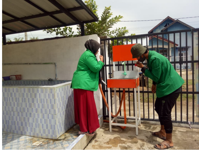
Mahasiswa KKN Kelompok 318 sedang memindahkan tempat pencuci tangan ke tempat publik di lokasi KKN.