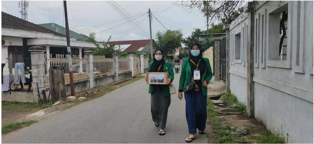
Mahasiswa KKN Kelompok 004 Universitas Malikussaleh menggalang dana untuk korban kebakaran di Dusun 4, Desa Tumpok Teungoh, Kecamatan Banda S Lhokseumawe, Sabtu (7/11/2020).