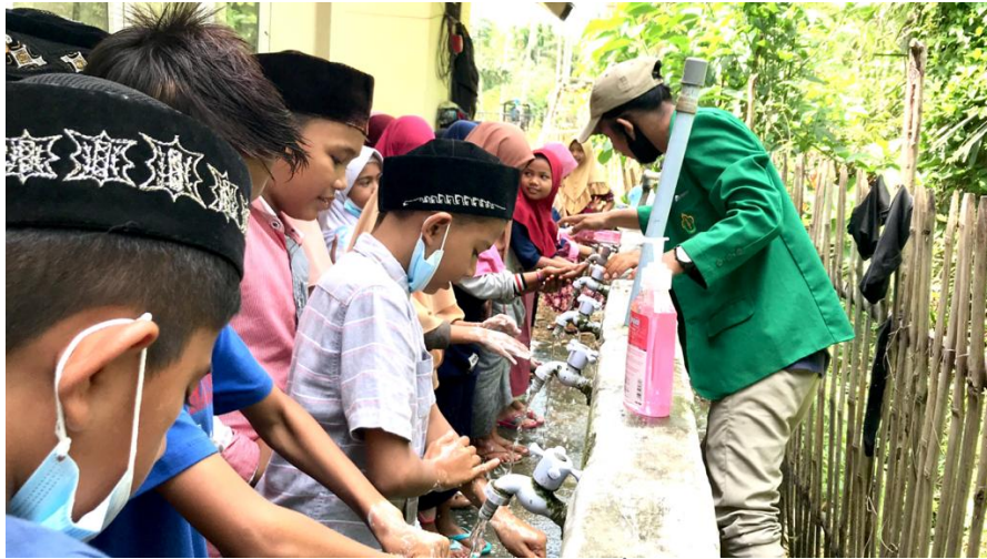
Mahasiswa KKN Covid-19 Universitas Malikussaleh dari Kelompok 324 melakukan sosialisasi pentingnya menjaga kesehatan di MIS Gampong Meunasah Manyang Kecamatan Muara Dua, Kota Lhokseumawe, awal November.