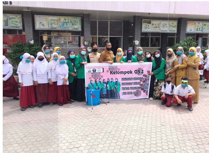
Mahasiswa KKN Univeritas Malikussaleh dari Kelompok 052 menyemprot disinfektak SD Negeri 21 Bireuen, belum lama ini.