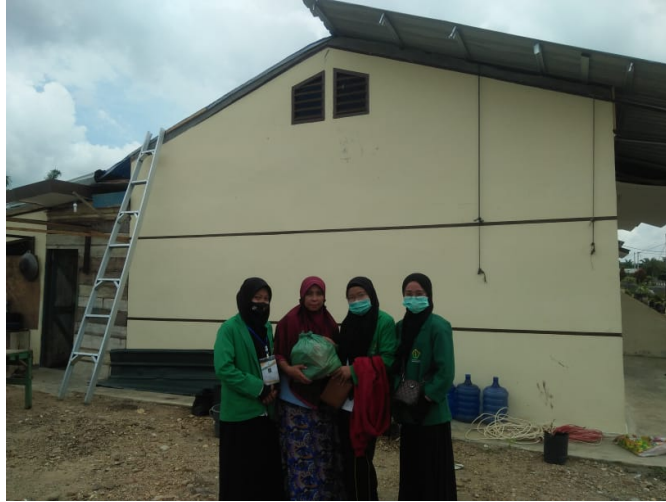
Mahasiswa Kelompok 124 menyantuni korban puting beliung yang melanda perumahan penduduk di Dusun STU Desa Sei Tarolat, akhir Oktober lalu.