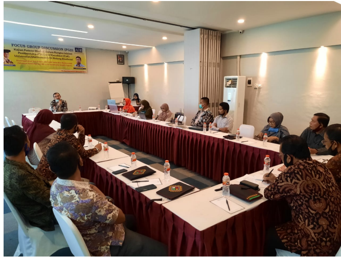
Focus Group Discussion (FGD) Project Implementation Unit Advanced Knowledge and Skills for Sustainable Growth Project, (PIU AKSI) Universitas Malikussaleh, di Idi Rayeuk.