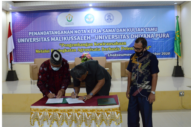
Universitas Malikussaleh menggelar kuliah umum dan penandatanganan nota kerja sama dengan Universitas Dhyana Pura Kabupaten Badung, Bali di Aula C Meutia, Kampus Bukit Indah, Lhokseumawe, Senin (23/11/2020).