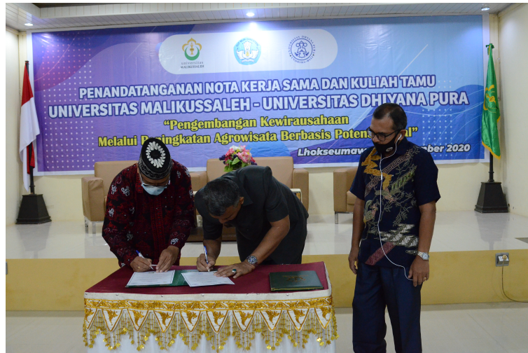
Universitas Malikussaleh menggelar kuliah umum dan penandatanganan nota kerja sama dengan Universitas Dhyana Pura Kabupaten Badung, Bali di Aula C Meutia, Kampus Bukit Indah, Lhokseumawe, Senin (23/11/2020).