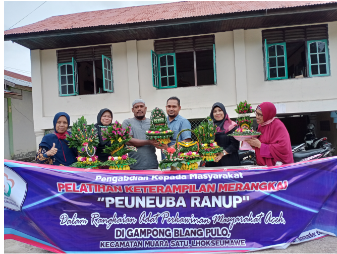
Rangkaian daun sirih "Peuneuba Ranup" yang dihasilkan oleh ibu-ibu PKK di gampong Blang Pulo dalam pelatihan yang diberikan oleh dosen FISIP Unimal. Ist