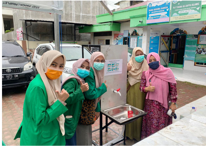
Dosen dan mahasiswa Fakultas Kedokteran melakukan sosialisasi protokol kesehatan di Sekolah Dasar Islam Terpadu (SDIT) Diana As-Saffa Islamic, Kota Lhokseumawe, Selasa (24/11/2020).