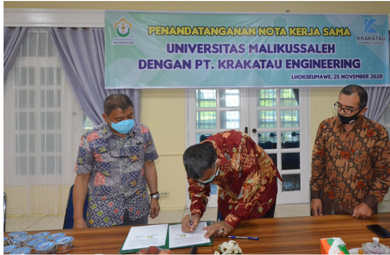
Universitas Malikussaleh (Unimal) menandatangani nota kerja sama dengan PT. Krakatau Engineering dan Construction di gedung Rektorat, Kampus Bukit In Lhokseumawe, Rabu (25/11/2020).