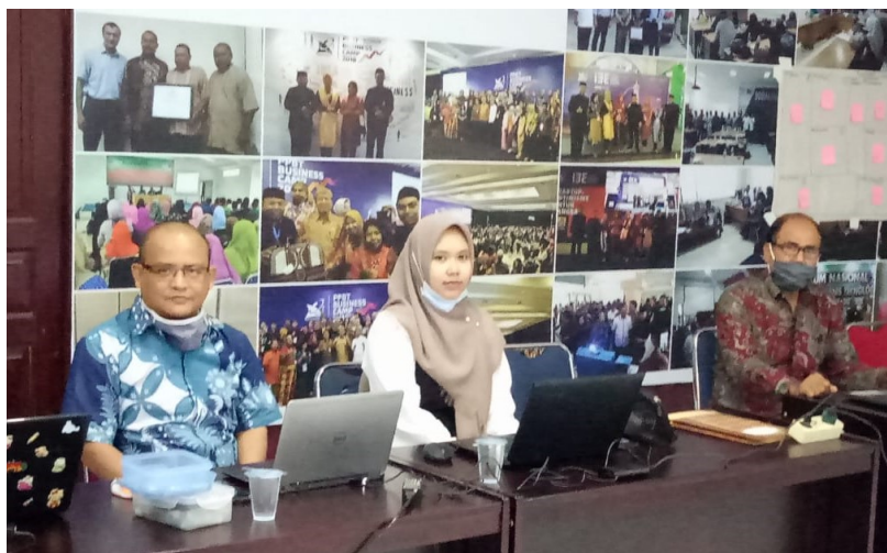
Dua calon startup binaan UPT Inovasi dan Inkubator Bisnis Universitas Malikussaleh menyampaikan presentasi, Selasa (24/11/2020).