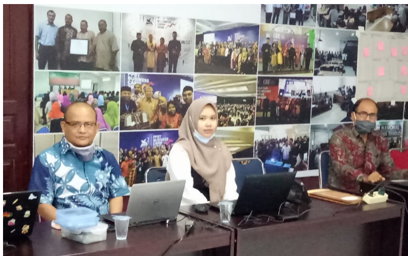
Dua calon startup binaan UPT Inovasi dan Inkubator Bisnis Universitas Malikussaleh menyampaikan presentasi, Selasa (24/11/2020).