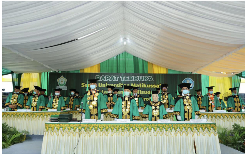
Universitas Malikussaleh menggelar upacara wisuda Angkatan XXIV di Kampus Reuleut, Aceh Utara, 28-29 November 2020.