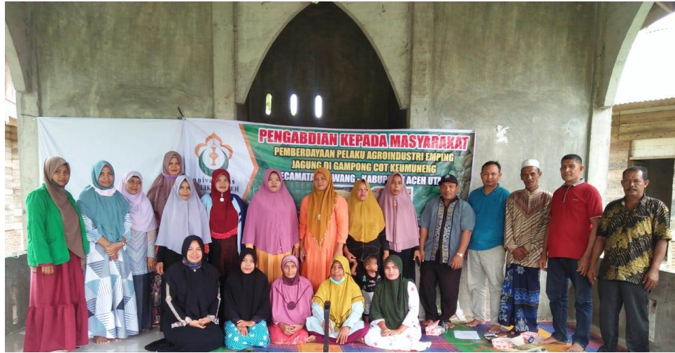
Dosen dari Program Studi Agribisnis Fakultas Pertanian Universitas Malikussaleh melaksanakan pengabdian kepada masyarakat di Gampong Cot Keumuneng Kecamatan Sawang, Aceh Utara, Sabtu (28/11/2020).