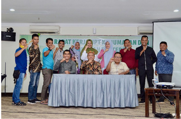
UPT Kehumasan dan Hubungan Eksternal Universitas Malikussaleh menargetkan sejuta pembaca Unimal News pada 2021 mendatang.