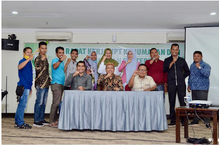
UPT Kehumasan dan Hubungan Eksternal Universitas Malikussaleh menargetkan sejuta pembaca Unimal News pada 2021 mendatang.