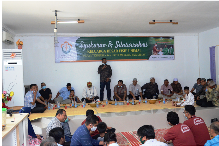
FISIP Universitas Malikussaleh mengadakan acara syukuran dan silaturahmi dengan masakan