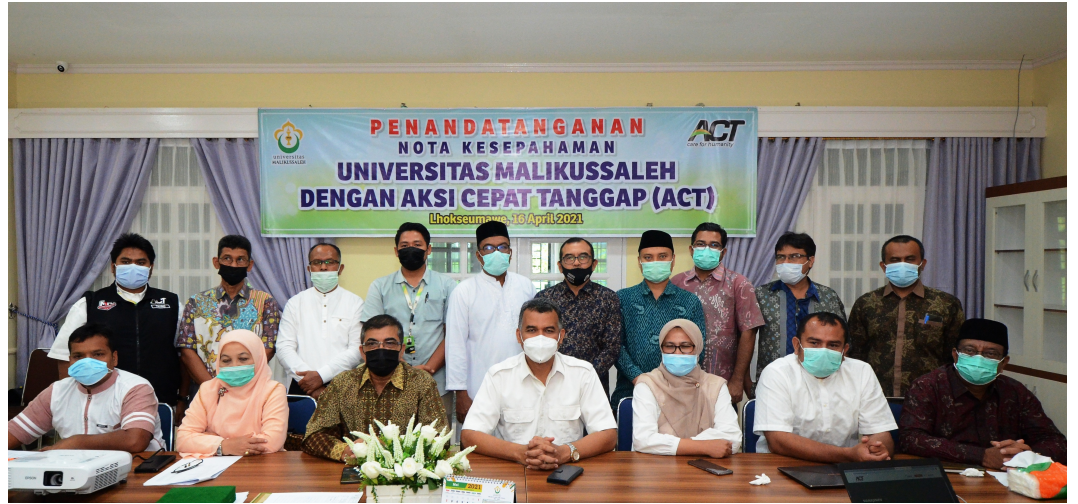
Foto bersama Pimpinan Unimal dengan ACT di Gedung Rektorat, Kampus Bukit Indah, Lhokseumawe.