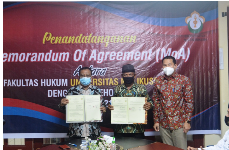
Bangun Gampong Bersinar, Mon Geudong Kerja Sama dengan Fakultas Hukum Unimal.