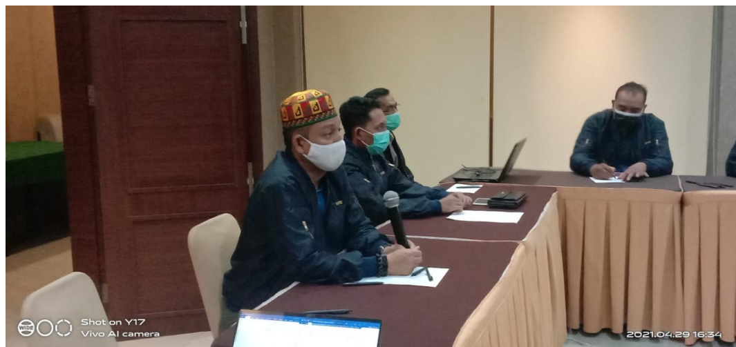
Kepala UPT Kehumasan Menjadi Informan Ahli Indeks Kemerdekaan Pers 2021 Aceh.