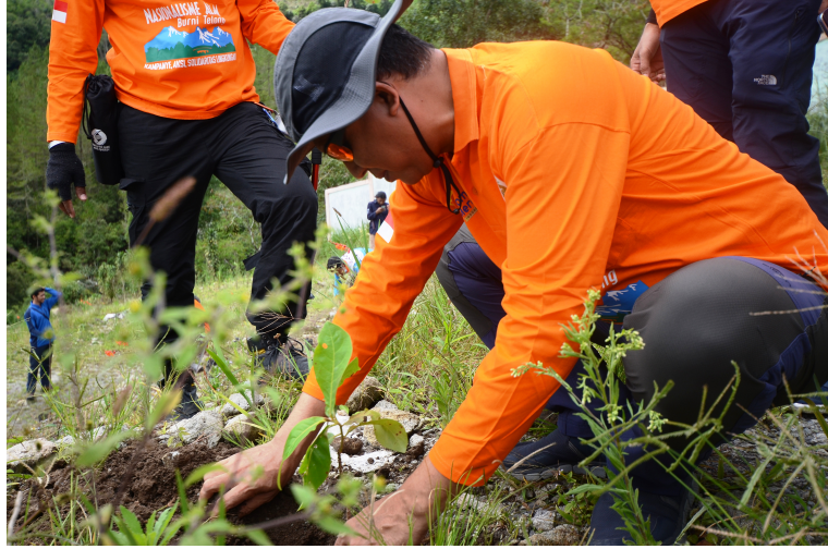
Unimal Tanam Seribu Pohon di Kaki Gunung Burni Telong.