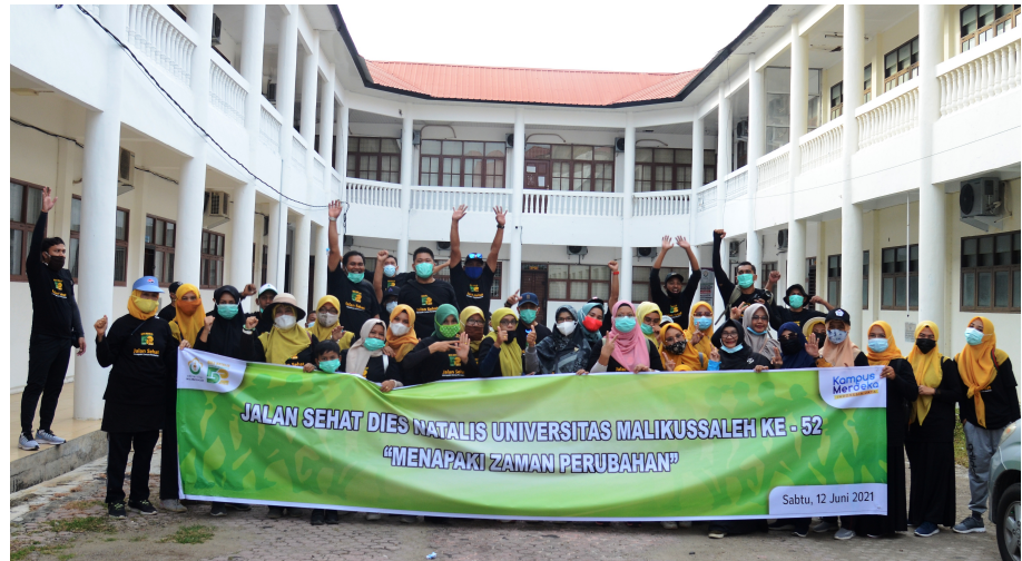
Peserta jalan sehat Dies Natalis Unimal Ke-52.