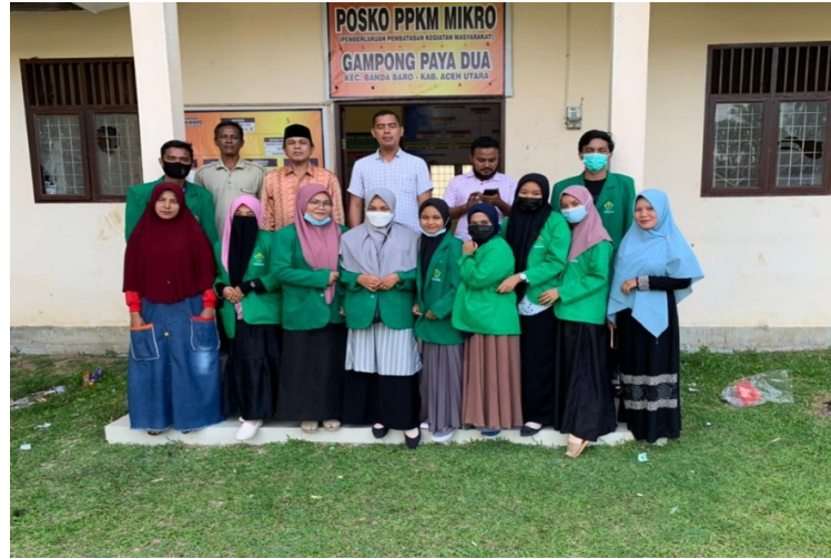
Mahasiswa KKN Universitas Malikussaleh Kelompok 19 berfoto bersama sebelum memulaik survei SDGs di Gampong Paya Dua Kecamatan Banda Baro, Aceh Utara.