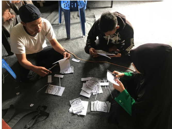
Mahasiswa KKN Kelompok 30 yang melaksanakan KKN di Desa Bahgie Bertona Kecamatan Bandar Kabupaten Bener Meriah.