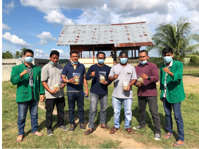
Kegiatan pelatihan di Balai Gampong Paya Rabo Lhok Kecamatan Muara Batu, Aceh Utara.