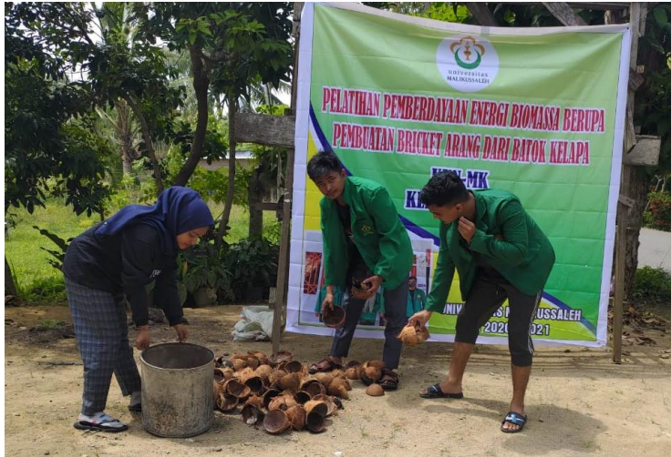
Mahasiswa KKN K35 Buat Bricket Arang dari Batok Kelapa.