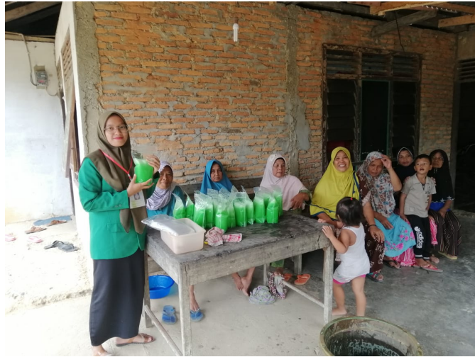
Mahasiswa KKN P27 Latih Masyarakat Cara Buat Sabun Cuci Piring.