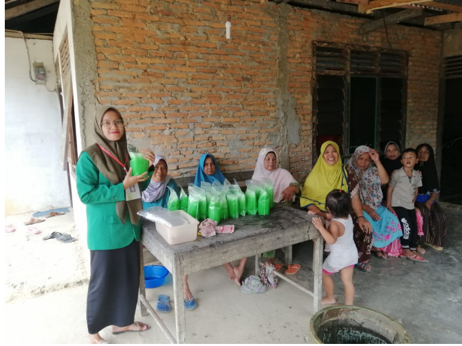
Mahasiswa KKN P27 Latih Masyarakat Cara Buat Sabun Cuci Piring.