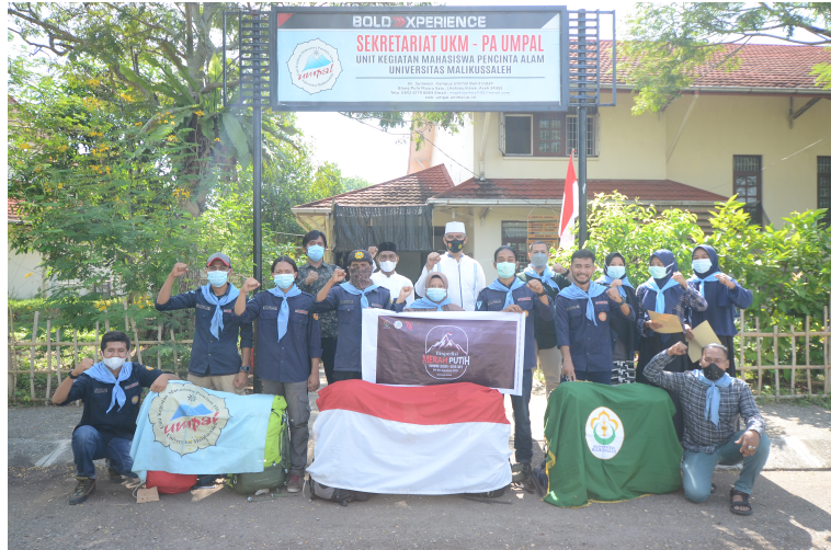
Enam Mahasiswa Umpal Unimal Akan Mendaki Gunung Leuser Selama 12 Hari.