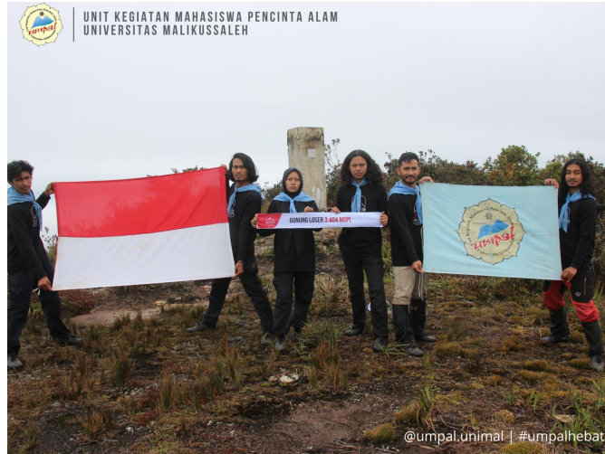
Meriahkan Hari Kemerdekaan Ke-76, Mapala Unimal Kibarkan Bendera Merah Putih di Puncak Leuser.