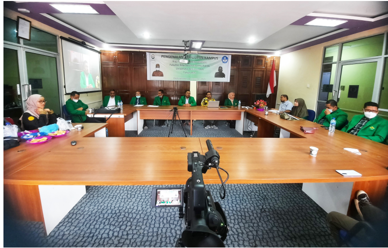
756 Maba FISIP Universitas Malikussaleh Ikuti PKKMB Via Daring.