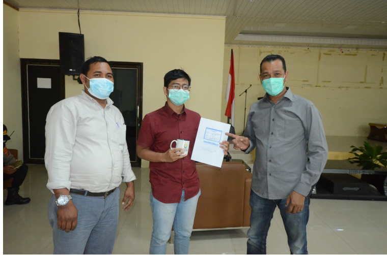
Tim dari UPT Kehumasan dan Hubungan Eksternal Unimal membagikan Mug (Gelas Cantik) kepada peserta Vaksin.