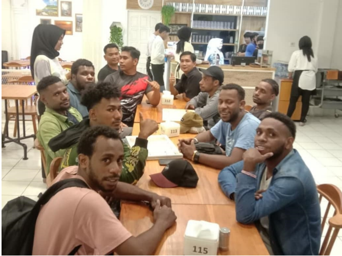
Mahasiswa ADiK Dikti Unimal Asal Papua Silaturahmi dengan Korem 011/Lilawangsa.