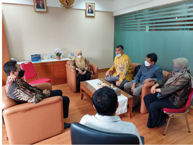
Rektor Unimal beserta tim bertemu dengan Koordinator Pokja Beasiswa Puslapdik Kemendikbusristek RI di Jakarta, Kamis (21/10/2021).