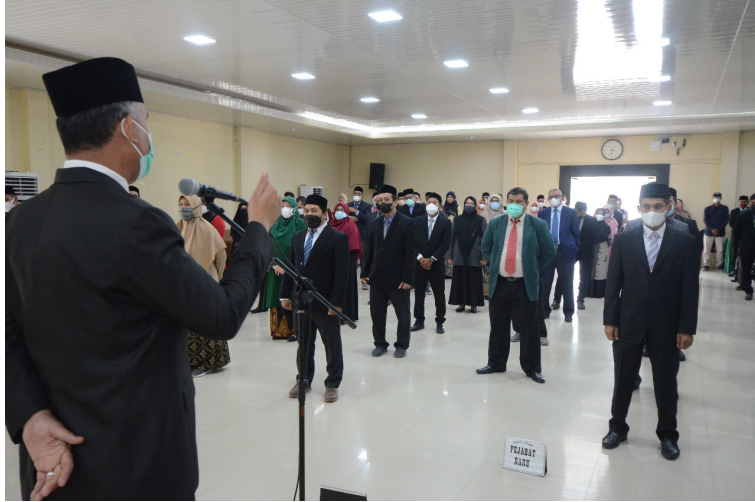
Rektor memberikan arahan saat pelantikan pejabat di lingkungan Universitas Malikussaleh.