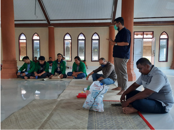
Mahasiswa KKN-GNRM Unimal serah terima Basum dan penutupan KKN GNRM dengan penandatanganan Kerja Sama.