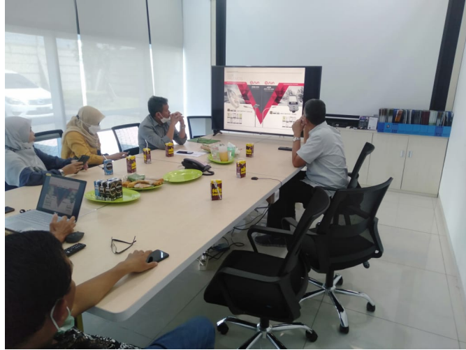
Rektor dan rombongan serius memperhatikan penjelasan di PT Santinilestari Energi Indonesia, Jum'at (22/10/2021).