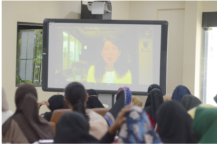
Jurusan Antropologi dan Sosiologi Unimal Gelar Kuliah Umum.