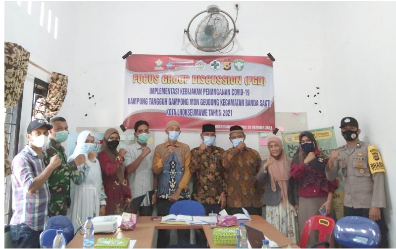
Dosen FISIP Universitas Malikussaleh Gelar FGD Tentang Kebijakan Penanganan Covid-19.