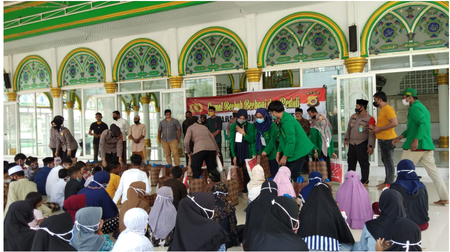
Mahasiswa KKN 08 Bantu Polres Lhokseumawe Bagi Sembako Kepada Yatim Piatu.