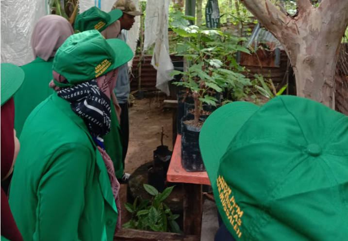
Mahasiswa KKN-PPM 201 Ikut Partisipasi Pembibitan Tanaman Anggur di Palda.