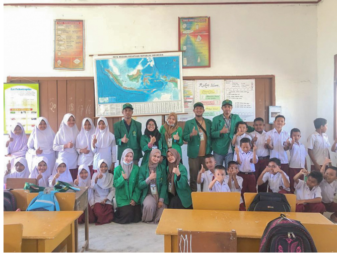
Mahasiswa KKN 255 Beri Edukasi Untuk Siswa SD Tentang Kesehatan Mental.