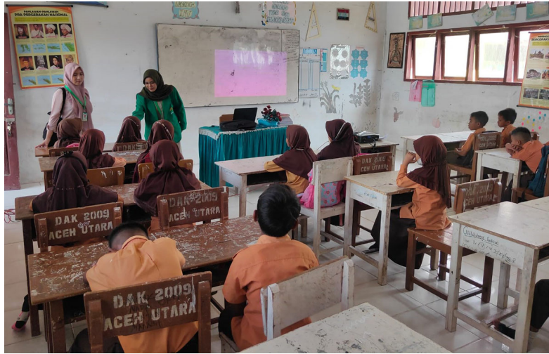
Mahasiswa Kuliah Kerja Nyata (KKN) Universitas Malikussaleh dari Kelompok 108 melakukan kegiatan sosialisasi kenakalan anak di SD Negeri 4 Muara Batu, Desa Keude Bungkaih, Kecamatan Muara Batu Kabupaten Aceh Utara, beberapa waktu lalu.