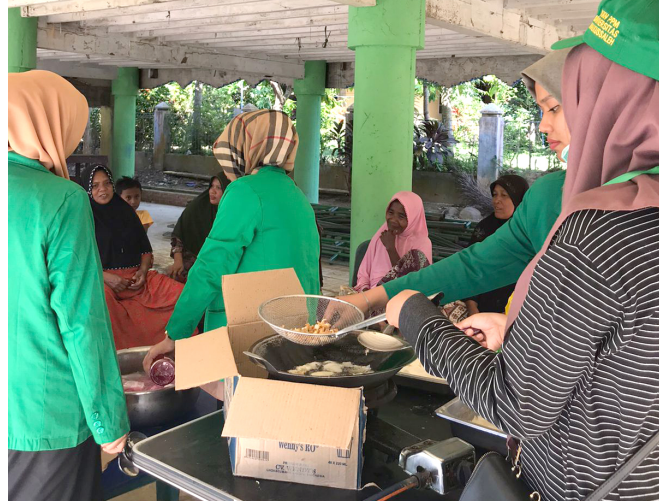
Di Gampong Buket, Mahasiswa KKN 078 Ajarkan IRT Bangun Bisnis Keripik dari Pepaya Muda.