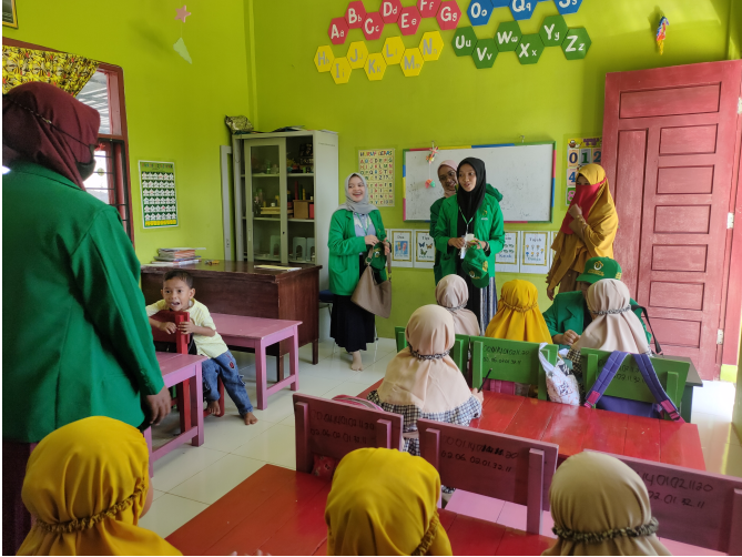
Mahasiswa Mengajar, Jadi Program Rutin Kelompok KKN 186 di PAUD Ar-Rahmah.